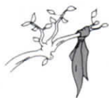
ганчірка на гілці